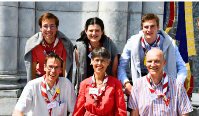
En haut : la coord' - En bas : le Trio