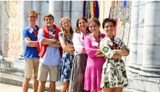
Le staff anim'

Merci aux staffs, aux resp'hôs, au Trio, à la coord' pour leur investissement pendant l'année et le pélé !