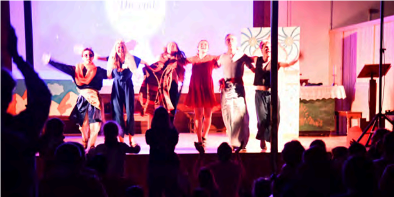
La fameuse Mer'Veillée du staff anim'