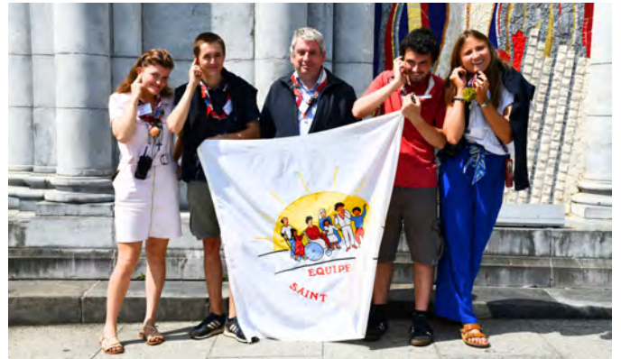
Le staff matos