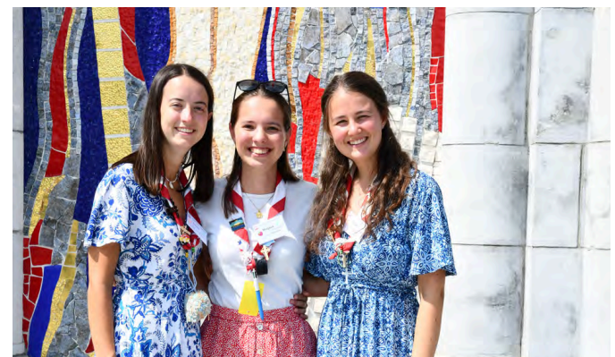
Le staff musique