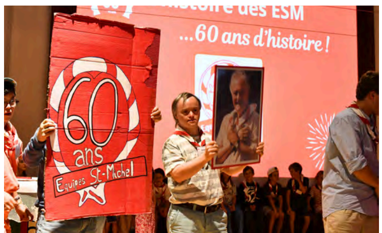
Le 60e anniversaire des Équipes au Café-Bar