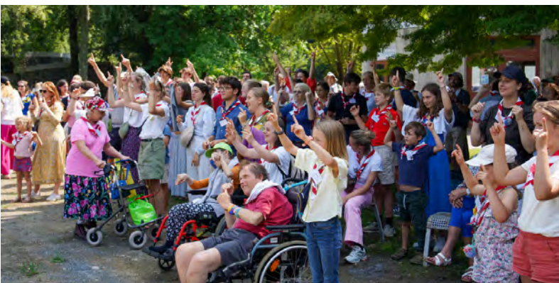
La fête de l'amitié