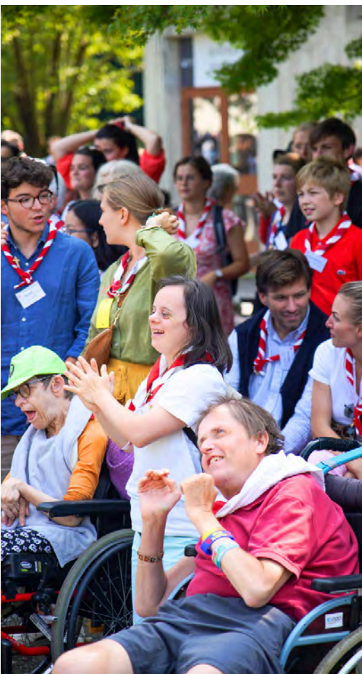
La fête de l'amitié