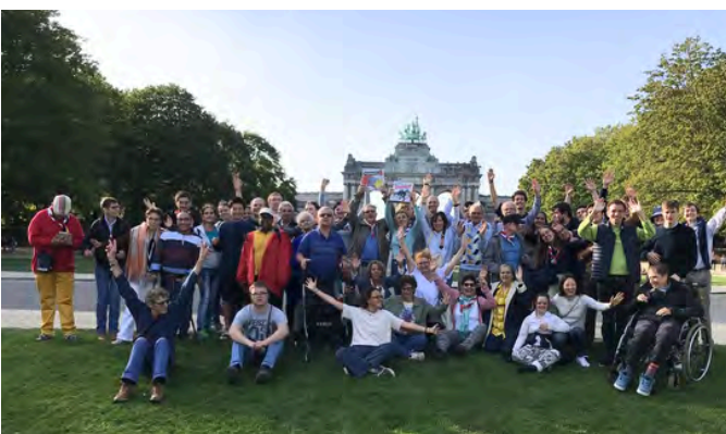
Le staff Entre-Lourdes